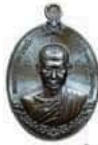
เนื้อนวโลหะ