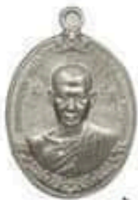
เนื้อเงิน