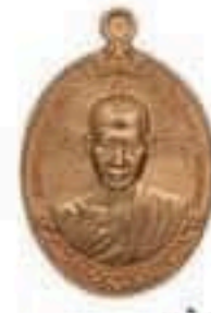
เนื้อทองแดง